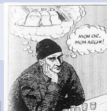
« Séraphin illustré », Le Bulletin des agriculteurs , déc. 1951