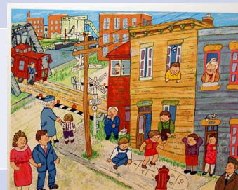
« La maison de Jean Lévesque » illustrations de Bonheur d'occasion par Miyuki Tanobe, 1983

Activités : Analyse d'extraits, repérage de procédés Atelier sur la représentation de la ville (à déterminer) : contribution au journal de bord Rédaction d'une dissertation